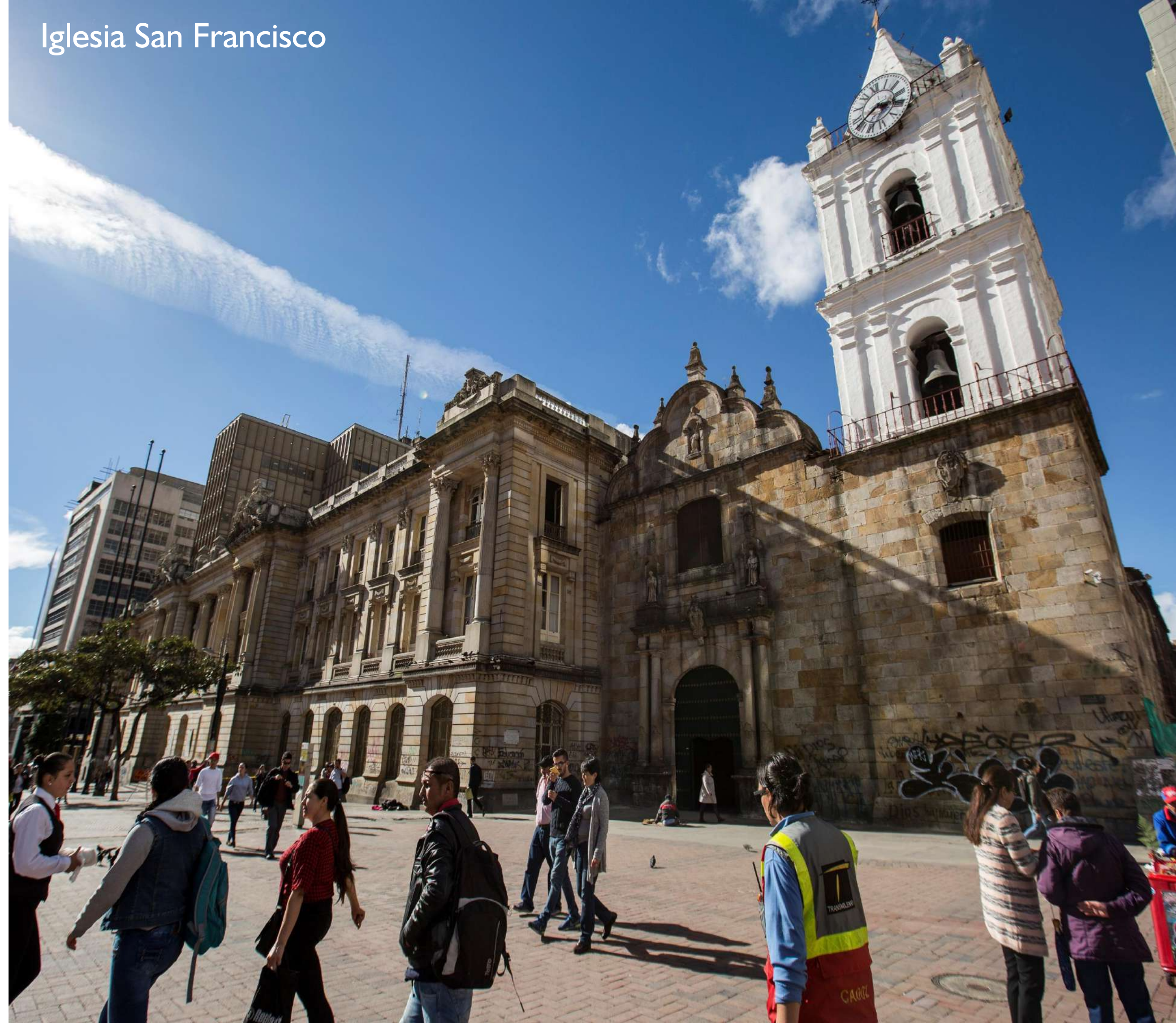
Iglesia San Francisco