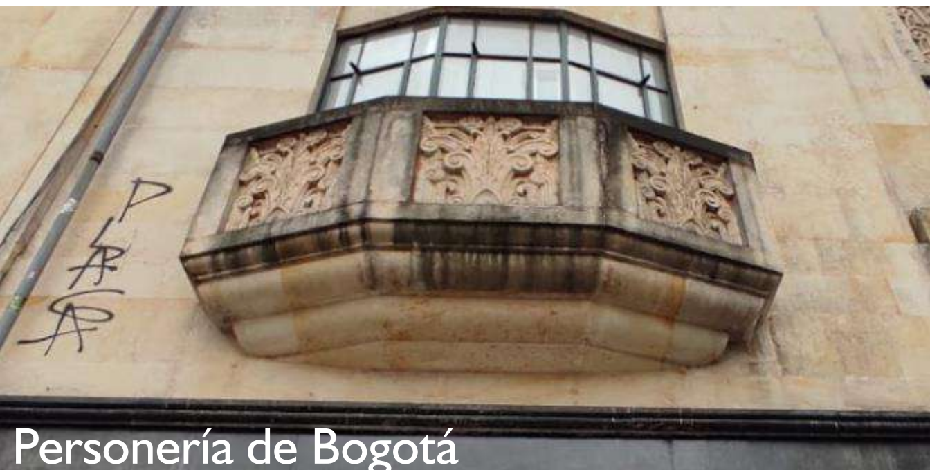
Personería de Bogotá