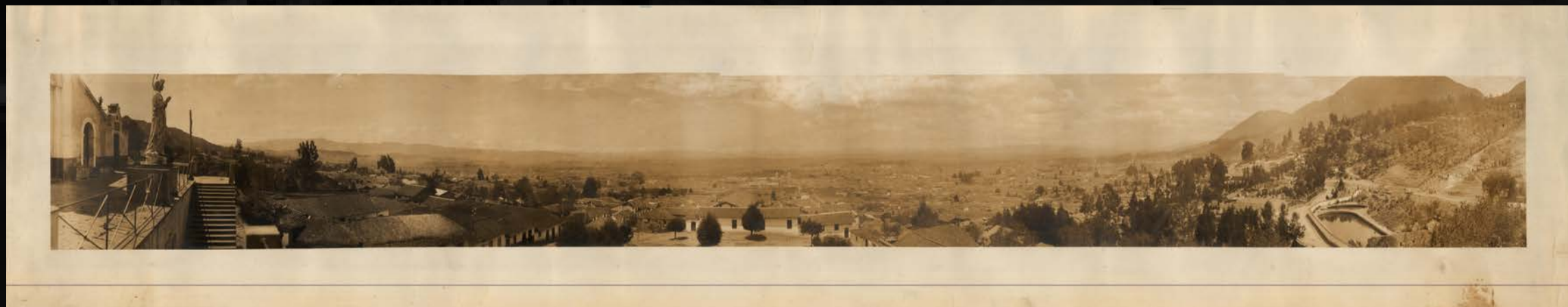
Autor desconocido [Panorámica de Bogotá tomada desde la Iglesia del Barrio Egipto] 1910

Algunos de los tesoros que allí encontraron