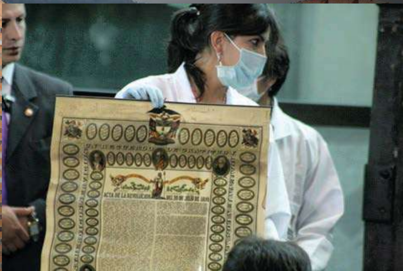
Acto de apertura de la Urna Centenaria. Foto: Diario El Universal , noticia: Urna centenaria: la historia no se detiene , 21 de julio de 2010.