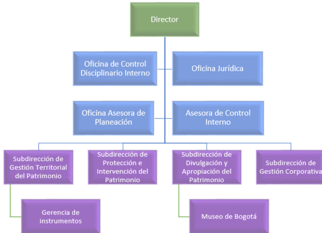
Imagen: Organigrama Instituto Distrital de Patrimonio Cultural - IDPC.