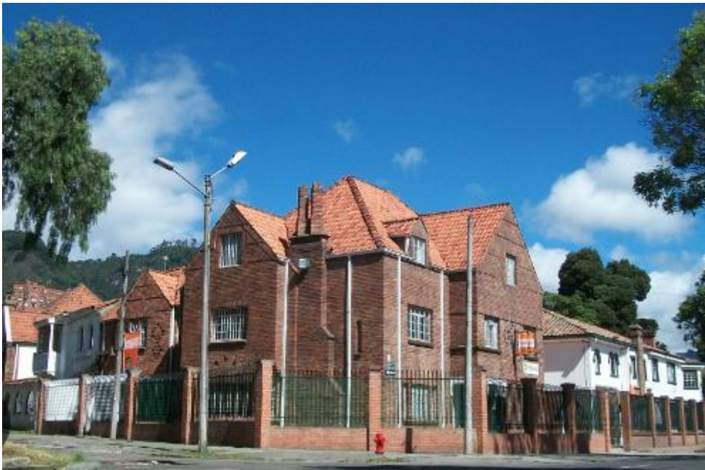
Foto: imagen de casa de la localidad de Teusaquillo