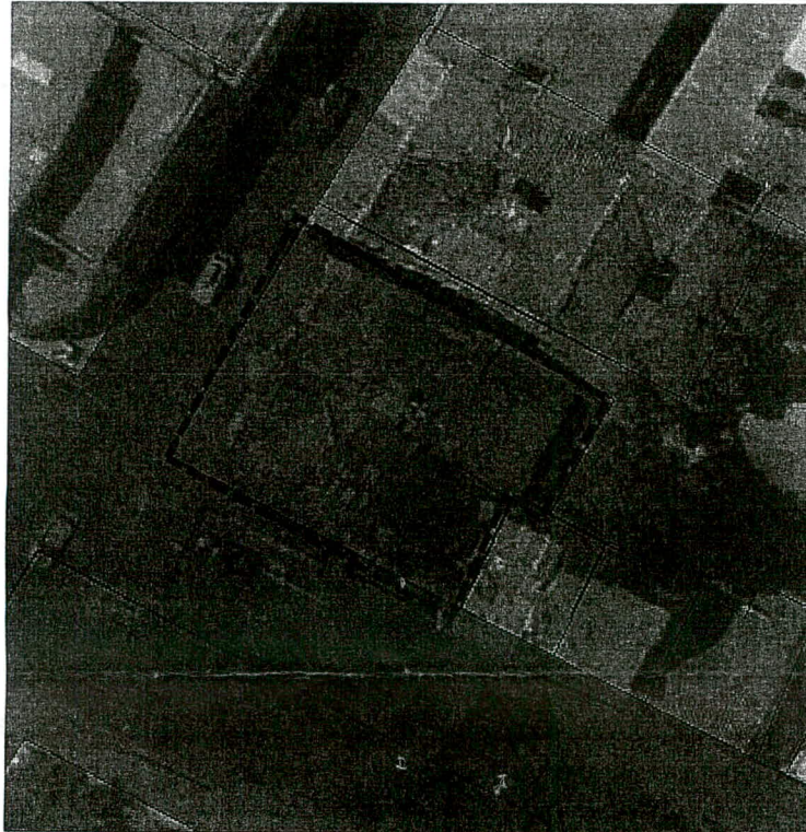
Localización del predio de la Calle 7 No. 8 A-54/60/64/66 y/o Carrera 9 No. 7-06 (Esquina).