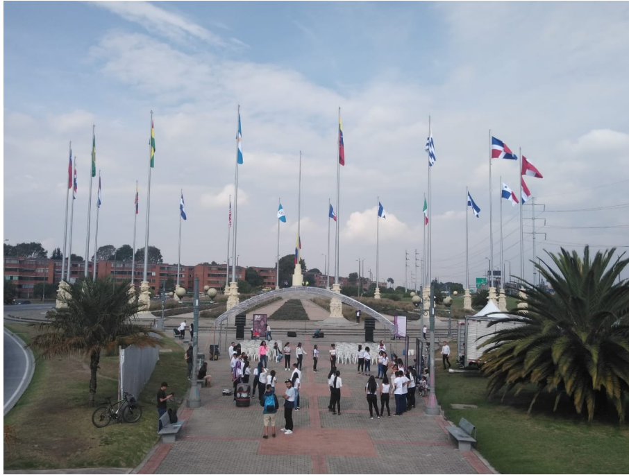
Imagen N.º 2 – Archivo IDPC marzo 2020

Posterior a esta gran intervención, el Instituto ha efectuado gestión interinstitucional con las entidades a cargo del mantenimiento del espacio, para fortalecer alianzas y esfuerzos para su protección y cuidado, en razón a las constantes afectaciones que a diario se acometen sobre el espacio patrimonial y en particular sobre los conjuntos escultóricos: