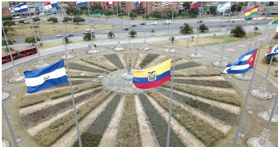
Imagen N.º 1 – Archivo IDPC marzo 2020

Esta intervención finalizó el 8 de marzo de 2020, fecha en la cual el IDPC, en el marco de la conmemoración del día internacional de La Mujer, entregó a la ciudadanía un espacio rehabilitado y recuperado.