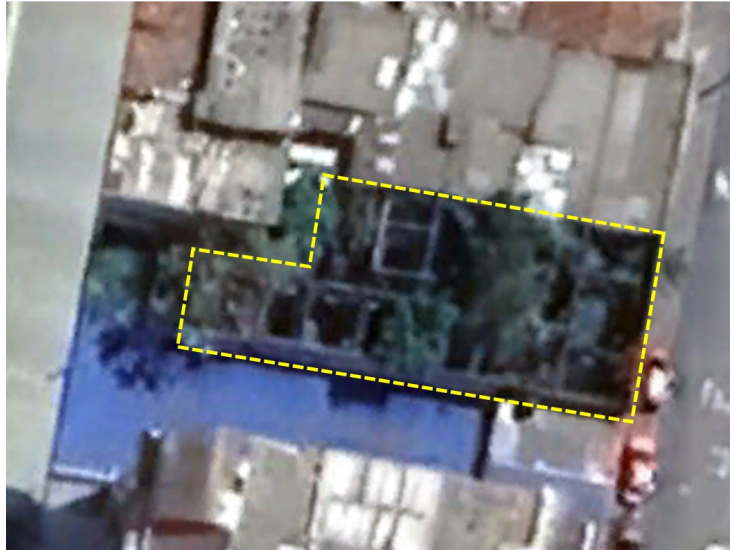
Imagen 2: Aerofotografía del año 2024 del inmueble localizado en la KR 17 63 73