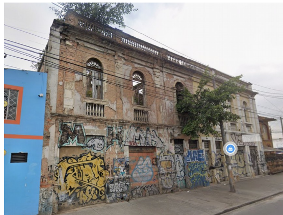
Imagen 1: Inmueble localizado en la KR 17 63 73 , situación en febrero de 2025

"Conservación del tipo arquitectónico. Se aplica a inmuebles del área afectada o en zonas de influencia de BIC del grupo urbano y del grupo arquitectónico que cuentan con características representativas en términos de implantación predial (rural o urbana), volumen edificado, organización espacial, circulaciones, elementos ornamentales, disposición de accesos, fachadas, técnica constructiva y materialidad, entre otros, así como prácticas asociadas del PCI identificadas en el PEMP que deben ser conservadas. En estos inmuebles se permite la intervención de los espacios internos del inmueble, siempre y cuando se mantenga la autenticidad de su estructura espacial y material."