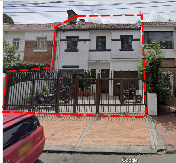
Imagen 1 (izquierda). Localización general inmueble ubicado en la DG 68 12 28 bien de interés cultural N2.