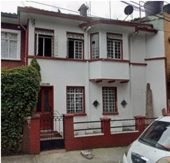
Estado del inmueble en el mes de febrero 2025.

Por la condición de patrimonio cultural, todo tipo de intervenciones en el inmueble de la DG 45 D 16 A 67, incluso reparaciones locativas y mantenimientos rutinarios, deben contar con autorización emitida por el IDPC previo a su ejecución, según los trámites establecidos por la entidad. En los casos en que la intervención requiera contar con una licencia de construcción, la aprobación del IDPC actuará como prerequisite para llevar a cabo el trámite ante alguna de las curadurías urbanas de la ciudad.