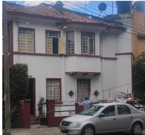
Estado actual del inmueble con trabajadores en obra.

En este marco, se realizó la revisión de los antecedentes del predio de la DG 45 D 16 A 67 que reposan en el archivo predial de la entidad, en donde se evidenció que a la fecha NO se ha solicitado ante esta entidad autorización alguna para realizar obras de intervención en el marco de los trámites denominados “autorización de proyectos para intervenir bienes inmuebles de la estructura integradora de los patrimonios” y “autorización para realizar reparaciones locativas y primeros auxilios en bienes inmuebles de la estructura integradora de los patrimonios” .