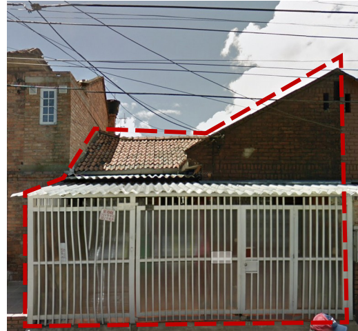
Imagen 2 (izquierda). Localización general del inmueble ubicado en la KR 56B 67 26 – SIU Modelo Norte.