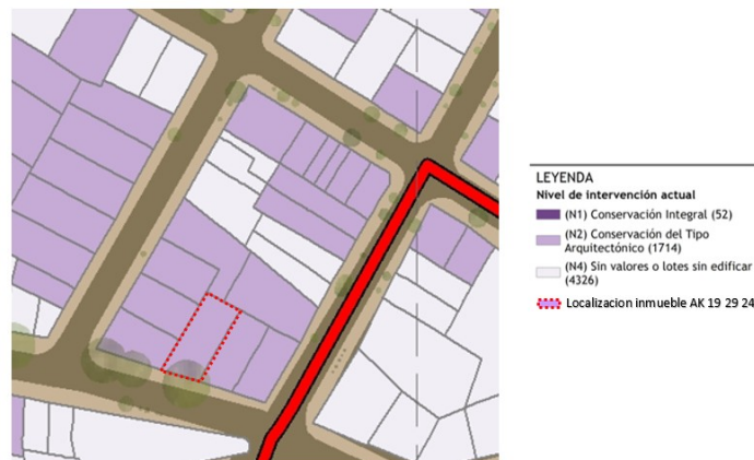
Imagen 2: Localización del inmueble ubicado en la Avenida Carrera 19 35 56 .

Adicionalmente el predio del asunto hace parte del área afectada del ámbito del Plan Especial de Manejo y Protección del SIU Teusaquillo, y se encuentra reglamentado para su intervención por medio de la Resolución No. 943 del 18 de diciembre de 2023 “Por la cual se deroga la Resolución 923 del 12 de diciembre de 2023 y se aprueba el Plan Especial de Manejo y Protección Distrital del Sector de Interés Urbanístico con Desarrollo Individual de Teusaquillo – PEMPDI SIU DI de Teusaquillo declarado como Bien de Interés Cultural Distrital del Grupo Urbano – BICD GU”, emitida por la Secretaría de Cultura, Recreación y Deporte.