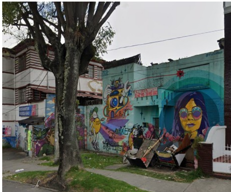
Imágenes 1: Fachada del inmueble localización en la Avenida Carrera 19 35 56 . Fuente: Google maps – Fotografía abril 2022.

El Instituto Distrital de Patrimonio Cultural (IDPC) recibió una comunicación por parte de los vecinos del barrio Armenia, mediante la cual se solicita un control urbanístico por la falta de mantenimiento del inmueble del asunto. (ver anexo)