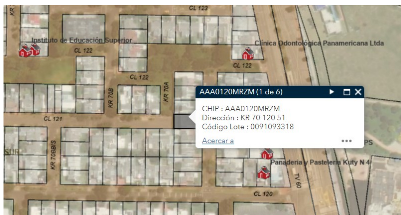
Imagen 1: Localización general predio ubicado en la KR 70 120 51

El inmueble ubicado en la KR 70 120 51 identificado con CHIP: AAA0120MRZM y código catastral: 91093318 , perteneciente a la localidad de Suba, barrio Niza; forma parte del sector de interés urbanístico con vivienda en serie (SIU VS) Niza , declarado mediante Decreto Distrital 619 de 2000, ratificado por el Decreto Distrital 190 de 2004 y el Decreto Distrital 555 de 2021, este último POT vigente.