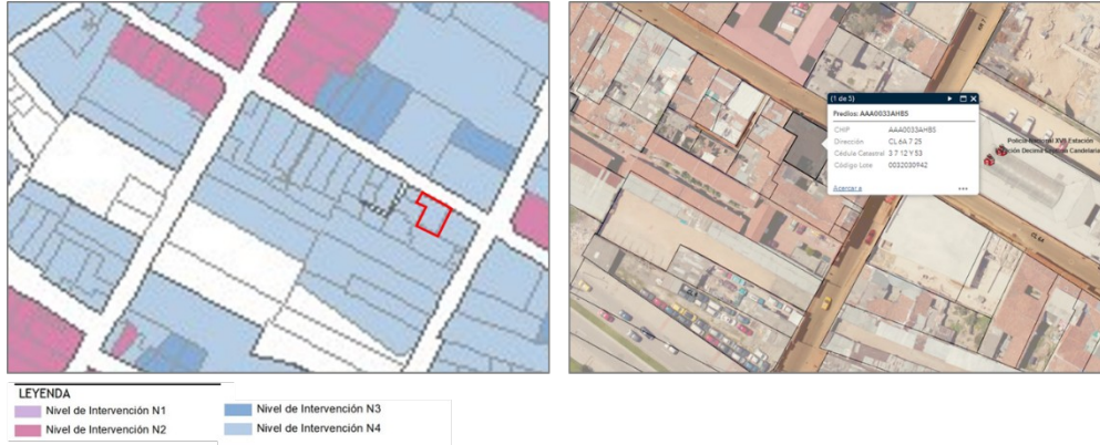
Ilustración 1.

de intervención cuatro (N4) 2 inmuebles sin valores y predios sin edificar y colinda con los predios clasificados en el mismo nivel.