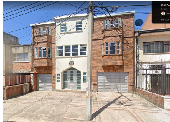
Imagen 5 y 6: Situación del inmueble de la DG 48 19 70; a la izquierda: año 2019, a la derecha: año 2020.

Pese a lo anterior, en la comparación de fotografías se evidenció una modificación en la fachada principal del inmueble, consistente en el reemplazo de vanos de ventana del primer nivel, por una puerta metálica de grandes dimensiones, al parecer para acceso vehicular. Adicionalmente se evidenció que la puerta de acceso peatonal se modificó su materialidad y se trasladó hacia afuera de su ubicación original. La materialidad del resto de la carpintería de la fachada principal del inmueble, también fue modificada.