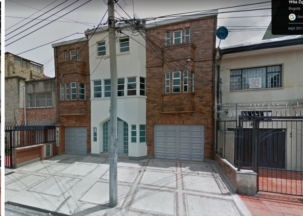
Imagen 3 y 4: Situación del inmueble de la DG 48 19 70; a la izquierda: año 2016, a la derecha: año 2017.