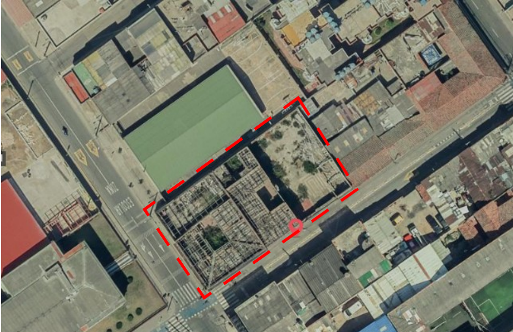
Imagen 1. Inmueble ubicado en la KR 80I 63 45 SUR – Sector de interés urbanístico – núcleo fundacional de Bosa