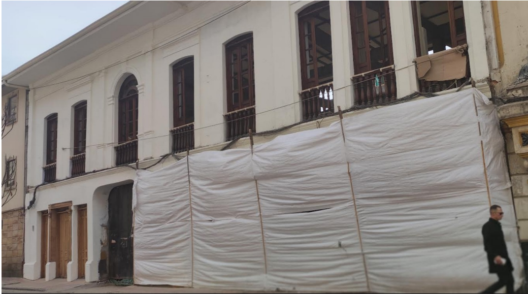
Fotografía 1. Se observa fachada del inmueble ubicado en la KR 9 10 59. Se evidencia pintura reciente de la fachada, zona de poli sombra en el primer piso costado norte. (Fecha de toma de la fotografía: 1 de junio de 2023)

En la visita, se golpeó y NO atendió nadie, por lo que solo se realizó el registro fotográfico de la fachada exterior del mismo; sin embargo, desde el exterior se evidenció ejecución de obra de intervención, pintura reciente en la fachada, no se observó valla de información de licencia de construcción o reparaciones locativas, ni tampoco se observa el sello de la Secretaría de Cultura, Recreación y Deporte.