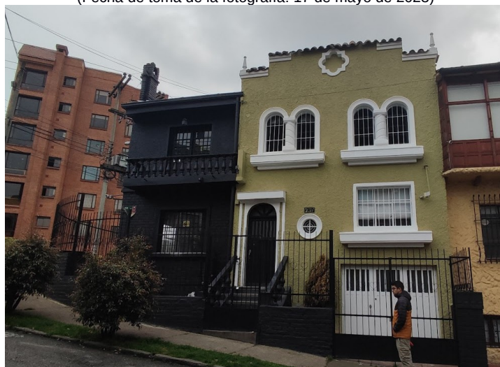
Fotografía 2. Se observa fachada por la diagonal del inmueble ubicado en la DG 55 4 33/37 y/o CL 54A 4 26. (Fecha de toma de la fotografía: 17 de mayo de 2023)