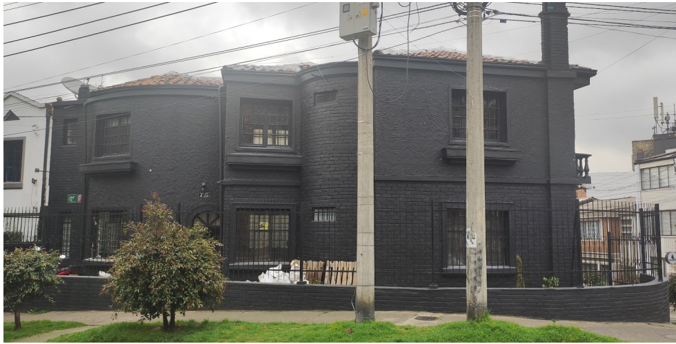
Fotografía 1. Se observa fachada por la calle del inmueble ubicado en la DG 55 4 33/37 y/o CL 54A 4 26. (Fecha de toma de la fotografía: 17 de mayo de 2023)