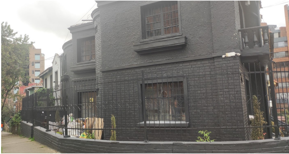
Fotografía 6. Se observa escombros ubicado en antejardín del inmueble ubicado en la DG 55 4 33/37 y/o CL 54A 4 26. (Fecha de toma de la fotografía: 17 de mayo de 2023)

En la visita, NO se permitió el acceso al interior del inmueble, por lo que solo se realizó el registro fotográfico de la fachada exterior del mismo; sin embargo, desde el exterior se evidenció la ejecución de obras de intervención e ingreso de materiales construcción, no se observó valla de información de licencia de construcción o de reparaciones locativas.