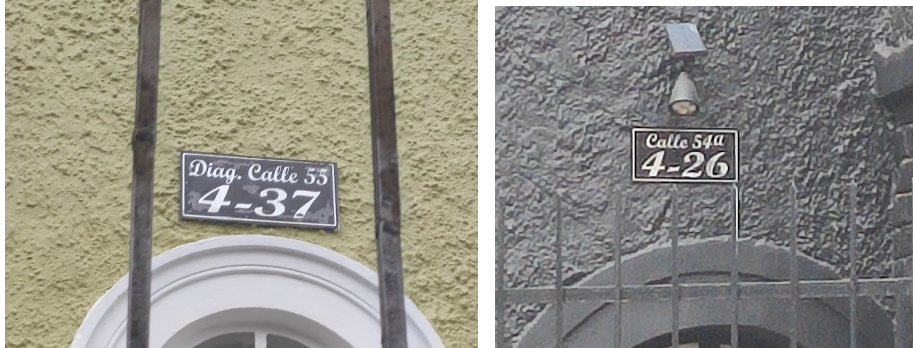
Fotografías 3 y 4. Se observa nomenclaturas del inmueble ubicado en la DG 55 4 33/37 y/o CL 54A 4 26. (Fecha de toma de la fotografía: 17 de mayo de 2023)