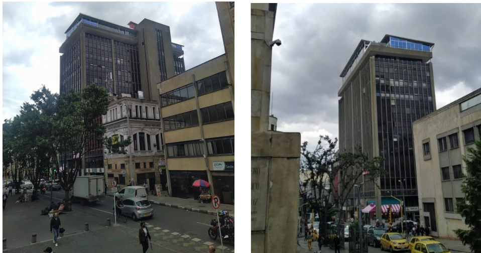
Fotografías 1 y 2: tomas generales del edificio de la KR 8 12 21 en relación con el contexto, en las cuales se puede observar la intervención realizada sin autorización en la cubierta.

Así mismo, el arquitecto Darío Zambrano, profesional adscrito a la Subdirección de Protección e Intervención del Patrimonio del Instituto Distrital de Patrimonio Cultural – IDPC, realizó una nueva visita de inspección visual al inmueble el pasado 13 de abril de 2023 , sin que se permitiera el acceso al inmueble más allá de la recepción, en donde se procedió a dejar un volante de aviso de la visita (ver acta de visita anexa). Sin embargo, se realizó un registro fotográfico desde el exterior, el cual se muestra a continuación: