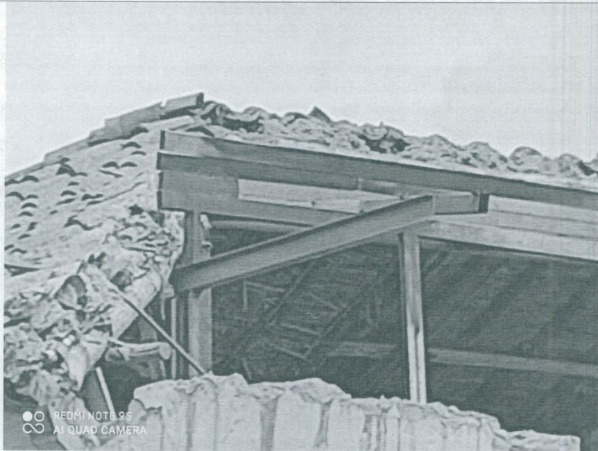
Fotografía 7 – Se observa modificación en la cubierta con instalación de estructura metálica ajena a las características de la cubierta original. (Fecha de toma de la fotografía 10 de noviembre de 2020)