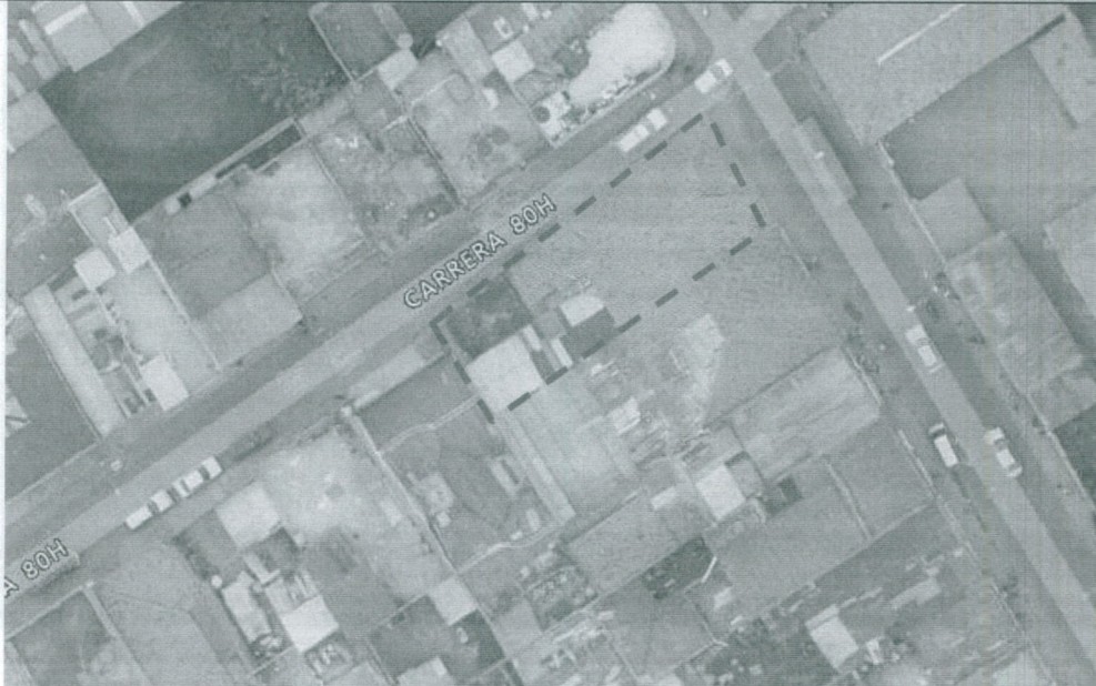
Imagen aérea del predio de la Calle 63 Sur No. 80 C – 85 – Carrera 80H No. 63 – 06/20/24 Sur (fecha de captura de la imagen: 2014)