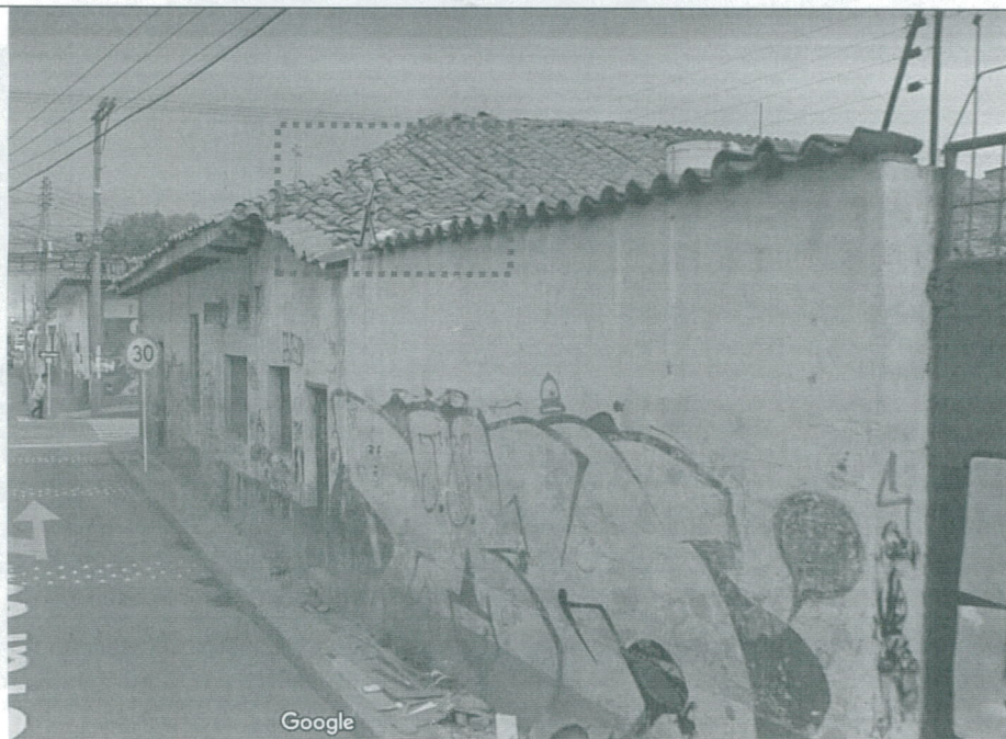
Fotografía 6 – Se observa fachada por la carrera 80 H- capturada por Google Street View en el año 2019. (Fecha de toma de la fotografía: mayo de 2019)