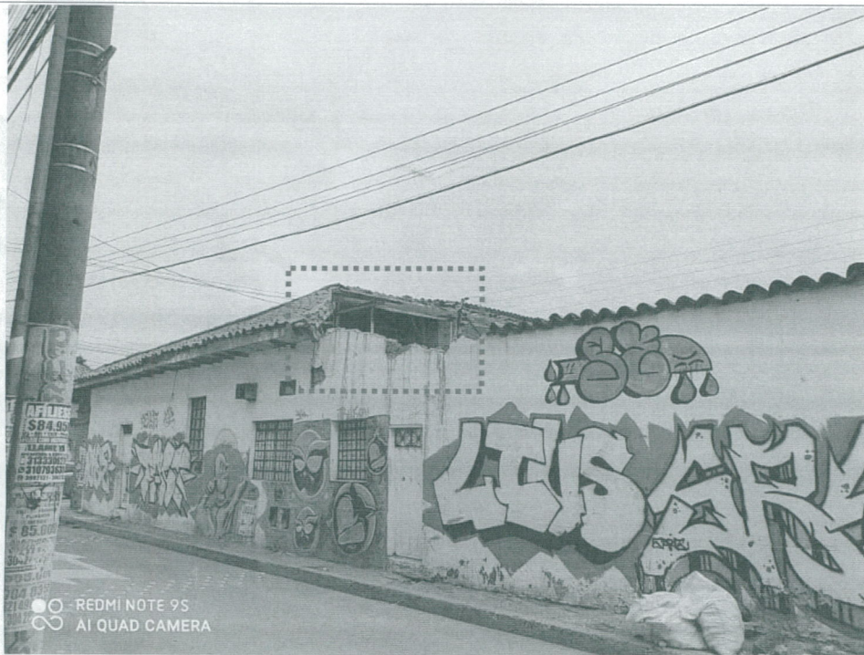
Fotografía 5 – Se observa fachada sobre la carrera 80 H, en donde se observa modificación en la cubierta con instalación de estructura metálica. (Fecha de toma de la fotografía: 10 de noviembre de 2020)