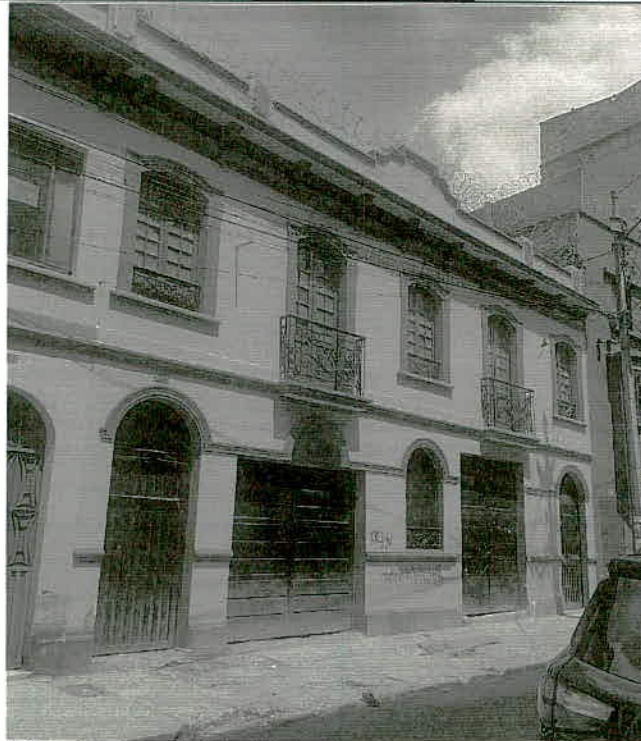
Fotografía 1 – Se observa fachada del inmueble ubicado en la Carrera 21 No. 12B-25/29/35 (Fecha de toma de la imagen 20 de octubre de 2021).