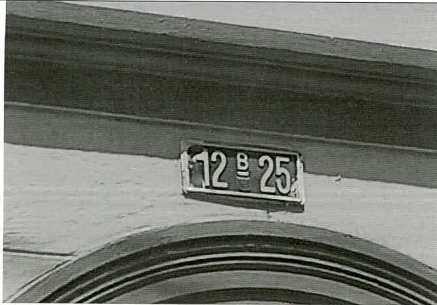
Fotografía 2 – Nomenclatura del inmueble ubicado en la Carrera 21 No. 12B-25/29/35 (Fecha de toma de la imagen 20 de octubre de 2021).