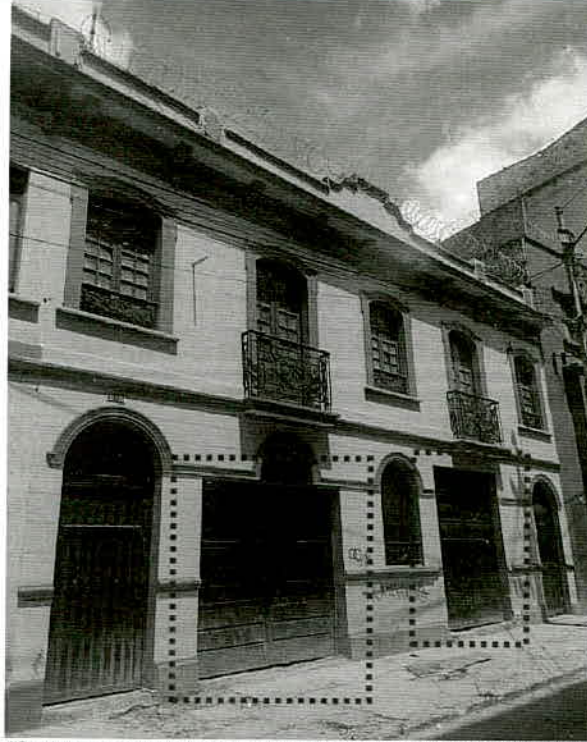
Fotografía 6 – Se observa fachada modificada con apertura de dos puertas de gran dimensión del inmueble ubicado en la Carrera 21 No. 12B-25/29/35 (Fecha de toma de la imagen 20 de octubre de 2021).