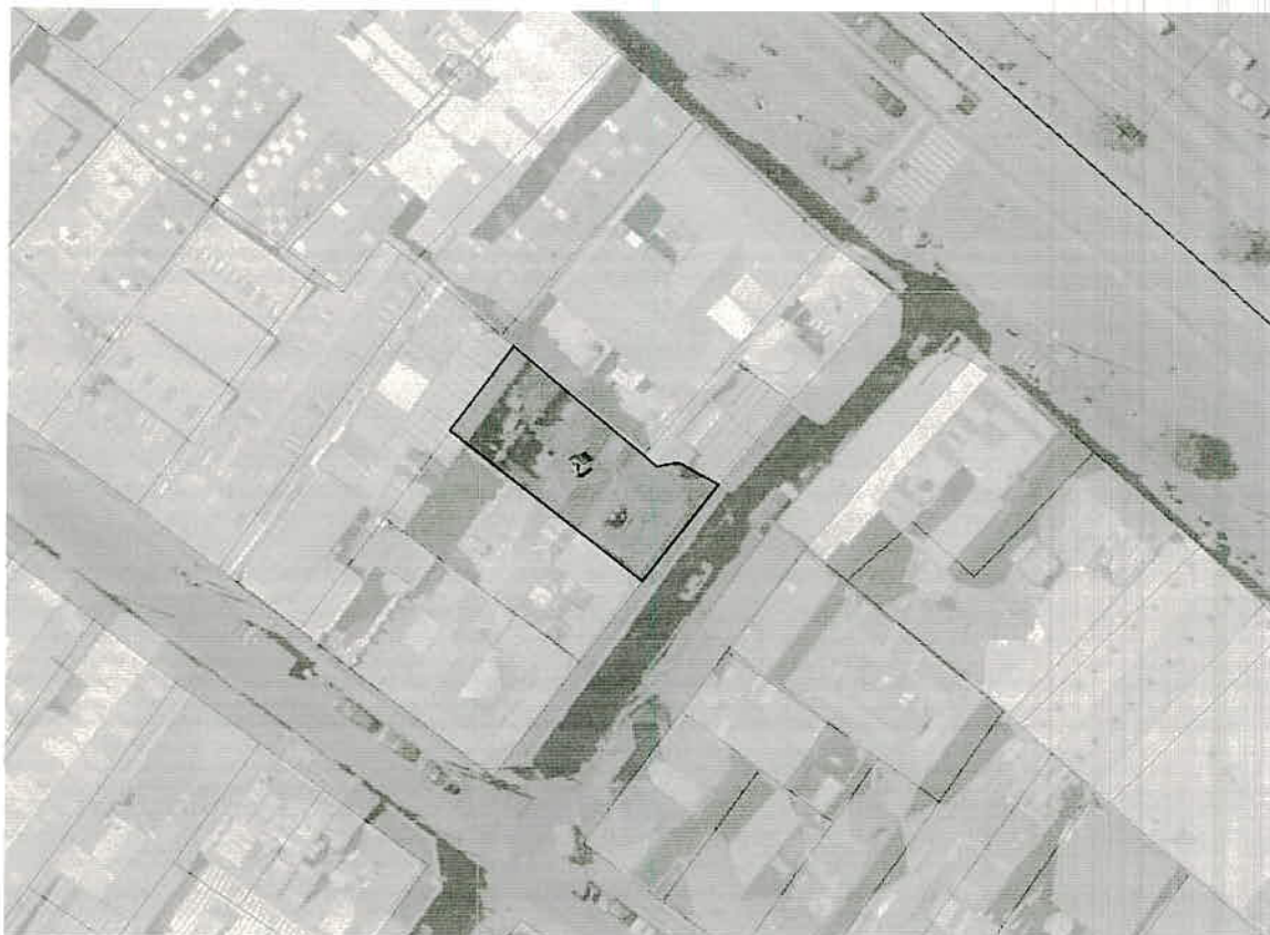
Localización del predio ubicado en la Carrera 21 No. 12B-25/29/35.