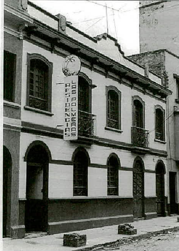
Fotografía 3 – Se observa fachada del inmueble ubicado en la Carrera 21 No. 12B-25/29/35, tomada de la ficha de valoración del inmueble (Fecha de toma de la imagen diciembre de 2002).