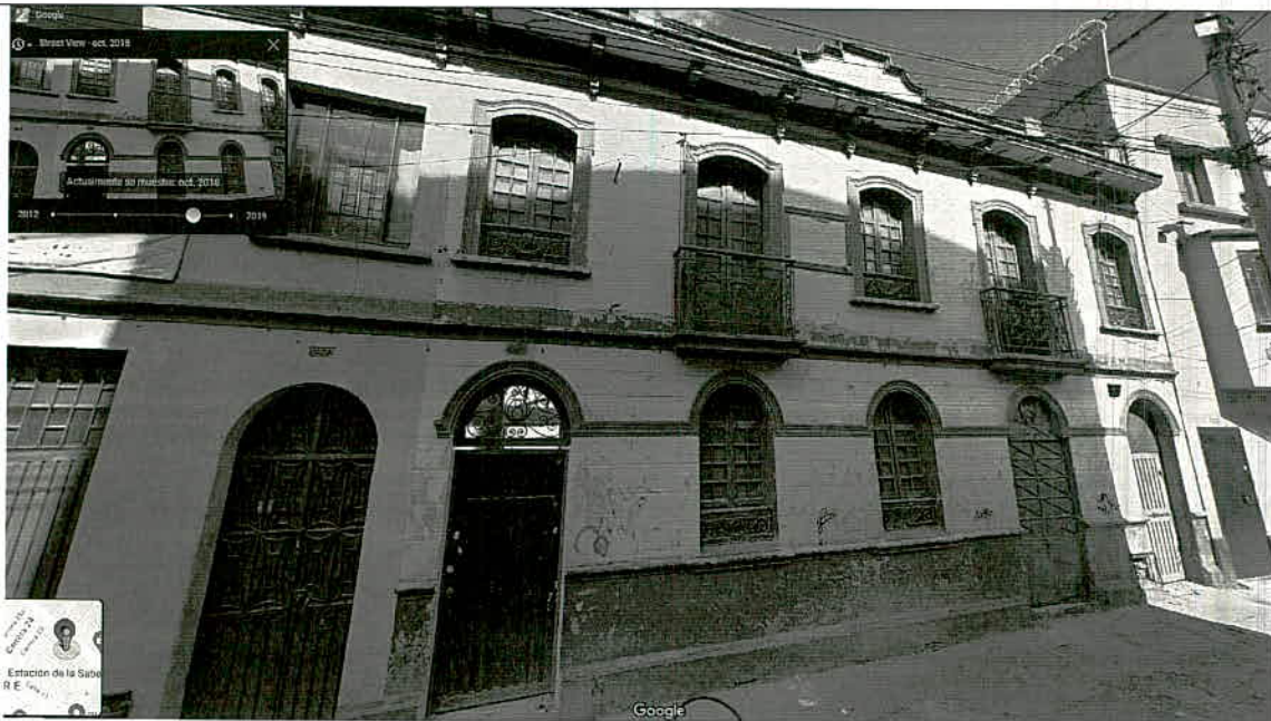
Fotografía 4 – Se observa fachada del inmueble Carrera 21 No. 12B-25/29/35, tomada de Google Maps – Street View (Fecha de toma de la imagen octubre de 2018).