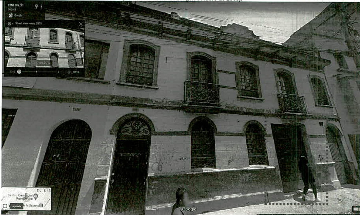
Fotografía 5 – Se observa fachada modificada de una puerta de mayor dimensión del inmueble Carrera 21 No. 12B-25/29/35, tomada de Google Maps – Street View. (Fecha de toma de la imagen mayo de 2019).