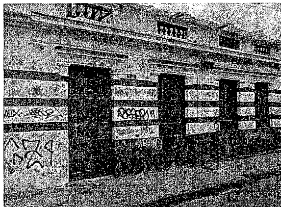
Fotografía 1 – Fachada del predio CL 12 C 2 - 29 (Fecha de toma de la imagen – 15 de mayo de 2019).

Dentro de las actividades de control urbano adelantadas por este Instituto se evidenció el mal estado en el cual se encuentra un muro que hace parte del inmueble localizado en la Calle 12 C No. 2 – 29 el cual a su vez amenaza con riesgo de colapso.