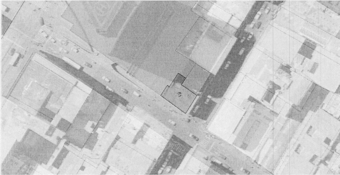
Localización del predio de la Carrera 9 17 19 y/o Calle 17 No 9-04