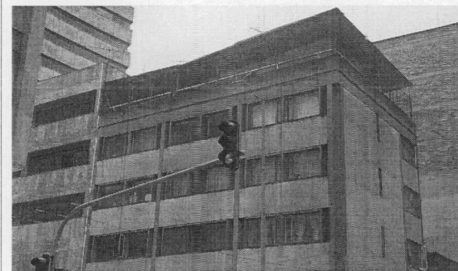
Fotografía 3 – Vista pisos cinco (5) parte de construcción retrocedida y cubierta en terraza en teje de Zinc, estructura metálica y baranda (Fecha de toma de imagen - 31 de mayo de 2019).