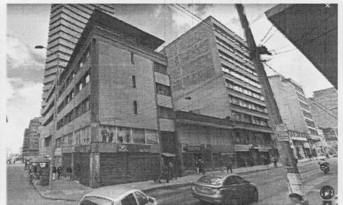
Imagen 1 – Fachada (Fecha de toma de la imagen - agosto de 2018).