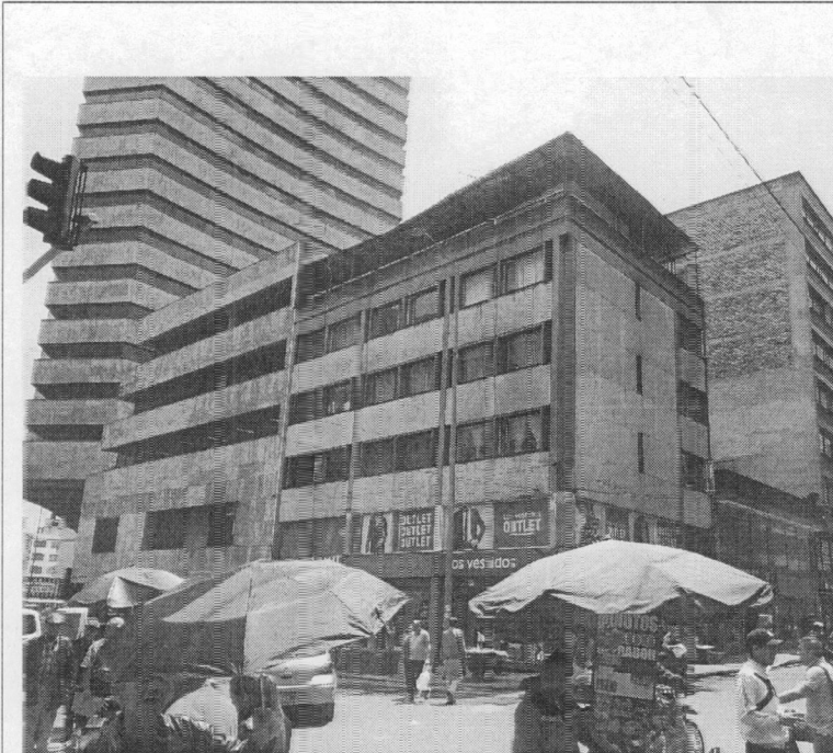
Fotografía 1 – Vista desde la KR 9 predio esquinero (Fecha de toma de la imagen - 31 de mayo de 2019).