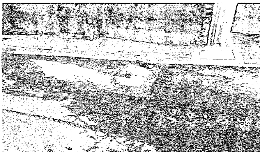
Perforación sobre el segmento vial CIV-17000094 la cual ha sido rellena con escombros y en la que actualmente hay empozamiento de aguas lluvias. Fotografía 2 – (Fecha de toma de la imagen 5 de febrero del 2019).