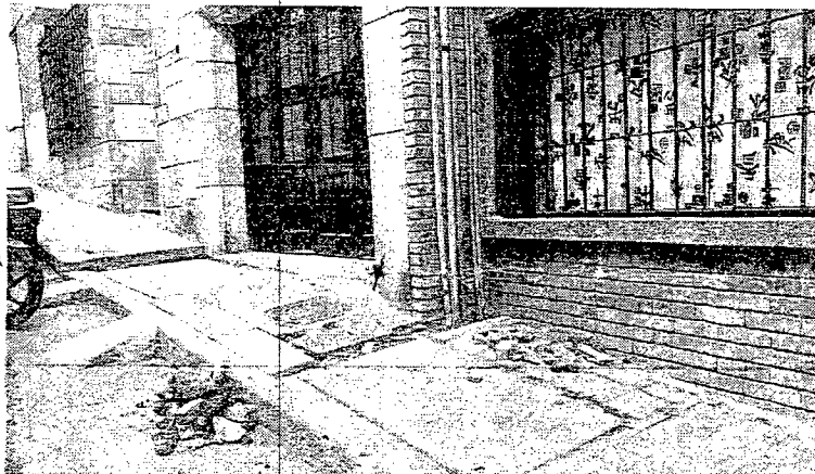
Caja de inspección instalada en el andén del inmueble localizado en la Calle 12D Bis No. 1A - 39/41. Fotografía 3 - (Fecha de toma de la imagen 5 de febrero del 2019).