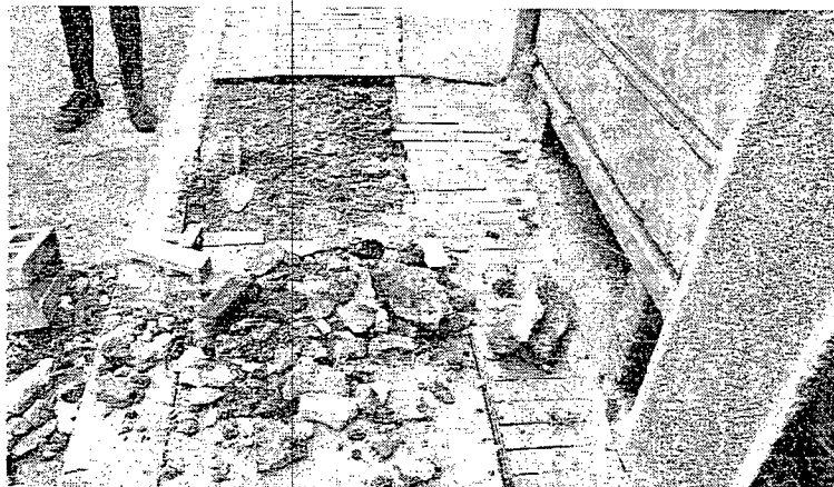
Actividad de instalación de adoquín sobre andén del inmueble localizado en la Calle 12D Bis No. 1A - 39/41 en donde se realizaron perforaciones. Fotografía 4 - (Fecha de toma de la imagen 5 de febrero del 2019).

Así las cosas, le informamos que de acuerdo a lo establecido en el Título I, Capítulo 1, Artículo 6 1 del Decreto 070 de 2015 2 , corresponde al Instituto Distrital de Patrimonio Cultural: