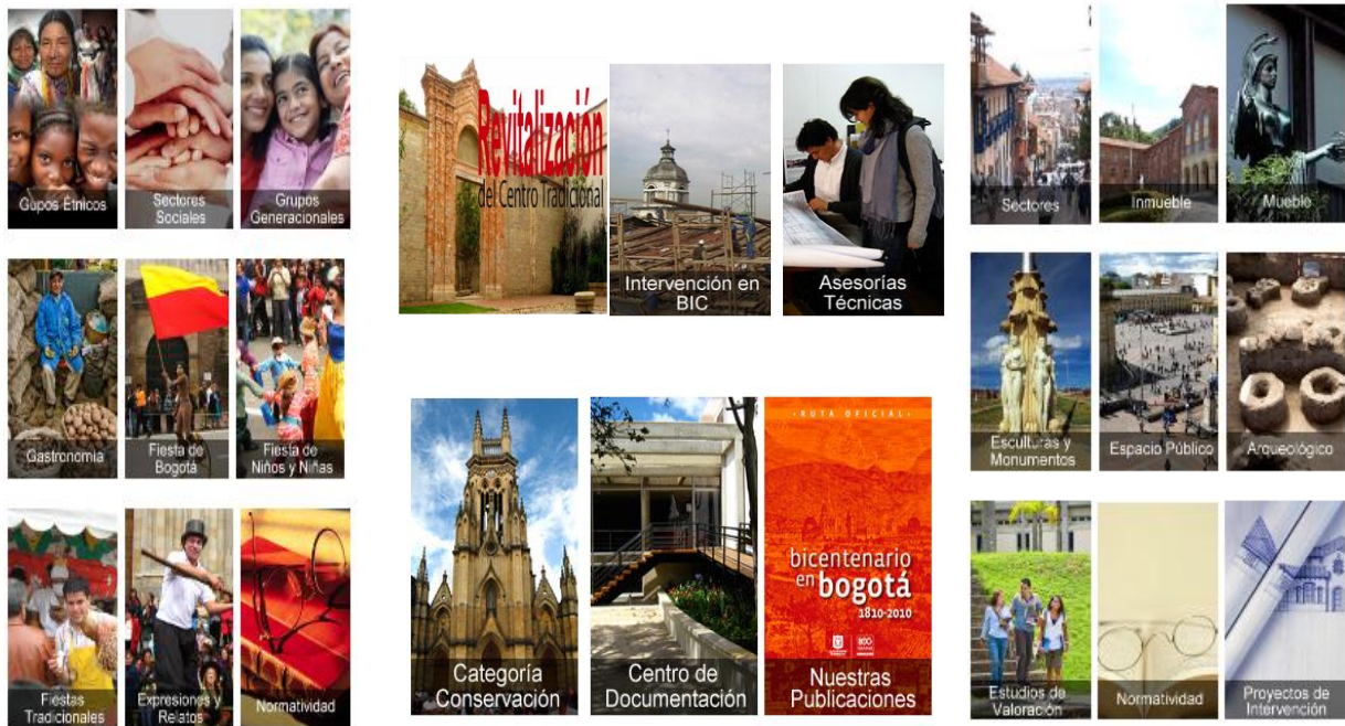
Tabla 1. Portafolio de productos y servicios.